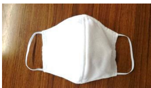
不織布立体マスク