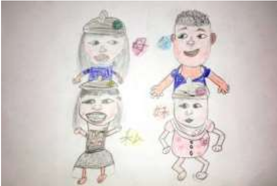
むすめ か かぞく 娘さんが描いた家族

みな わたし へいせい ねん ねん 皆さん、ごぶさたしています。私は平成16年～21年 キューオーエル ぶ ぶ はたら でQOL部、コーヒー部で働かせていただきました。 たいしよく いぬやまし とつ ねん 退職して犬山市へ嫁ぎ、もう8年。こちらの生活には な う そだ ちたほんとう なつ 慣れましたが、やはり生まれ育った知多半島は懐かし く、スーパーで“篠島産しらす”とが“知多のいちじく”を み しのじまさん ちた 見かけるとついつい買ってしまう私です。